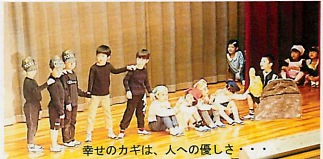
幸せのカギは、人への優しさ・・・

「ぼくは、 子分の役と ピアノのぼ んそうをし ました。ぼ んそうは、 速くならな いよう、指