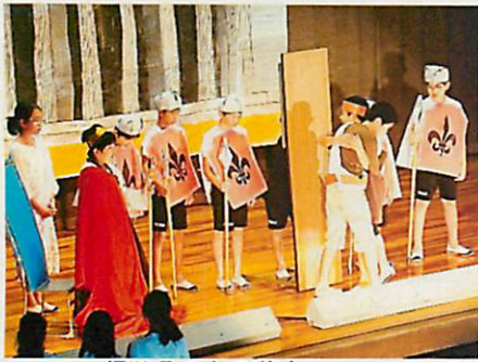
信じることの尊さ・・・